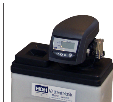
Automatiken kan vridas och monteras i tre olika lägen för bästa åtkomlighet.

Princess mjukvattenfilter är avsedda för hushåll och mindre industrier. Reducering av de hårdhetsbildande ämnena kalcium (Ca) och magnesium (Mg) leder till lägre energikostnader då varmvattenberedare skonas från igensättningar. Kalkfläckar på diskgodsd undviks och tvättmedelsförbrukningen minskar. Mjukvattenfiltren levereras även i specialutförande för reduktion av nitrat och humus.